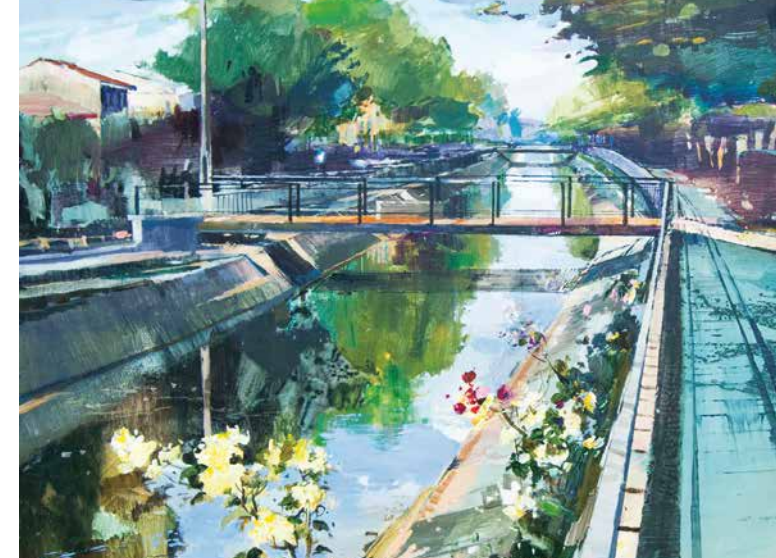
1º Premio 2017 - Eduardo Monteagudo